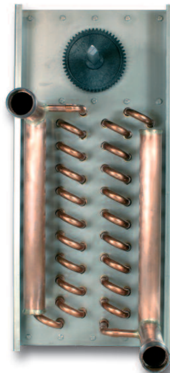
Kühler mit integriertem Bypass